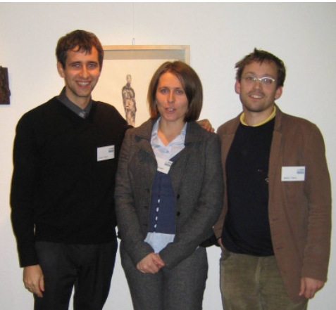
Die Alumni in Nürnberg