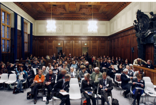
Im Schwurgerichtssaal 600, Ort der Nürnberger Prozesse