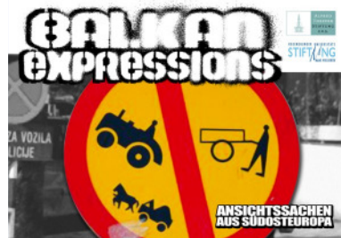
Balkan expressions, Veranstaltung im Rahmen der ersten Eurolecture

Das Eurolecture Gastdozentenprogramm zur Innovation in der Lehre ist seit dem Sommersemester 2006 Bestandteil der Wissenschaftsförderung der Stiftung.