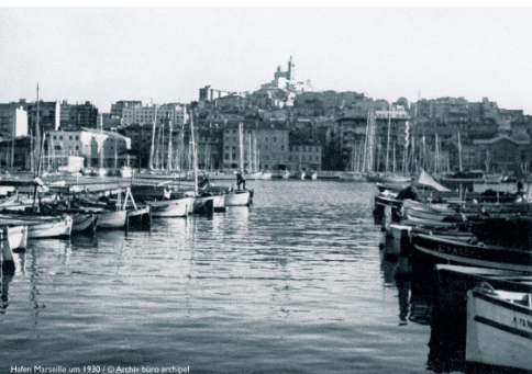
Hafen von Marseille, um 1930

Südfrankreich währte nur kurz: Mit dem Beginn des Zweiten Weltkriegs und dem Einmarsch der deutschen Truppen in Frankreich wurde es für viele zu einer Überlebensfrage, das Land schnell zu verlassen. Zahlreiche amtliche Dokumente und Briefwechsel mit Kollegen, die bereits in den USA lebten oder von dort gebürtig waren, lassen die ständige Furcht der politisch Verfolgten erahnen, die sich zudem mit einer abweisenden Bürokratie konfrontiert sahen. Denn auch in Frankreich galten sie nun als Angehörige eines „Feindstaates“ und wurden misstrauisch beäugt. Einige wurden im Lagern interniert – zum Beispiel in „Les Milles“ in der Nähe von Aix-en-Provence –, so auch Alfred Kantorowicz, der seine Erlebnisse in „Exil am Mittelmeer“ beschreibt.