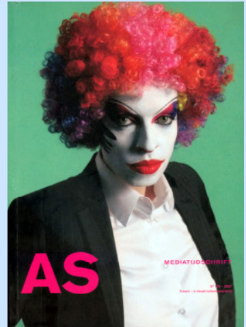
Cover AS – a visual culture quarterly