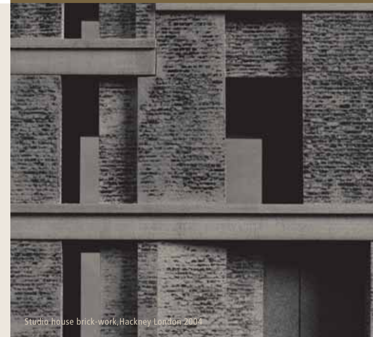
Studio house brick-work, Hackney London 2004